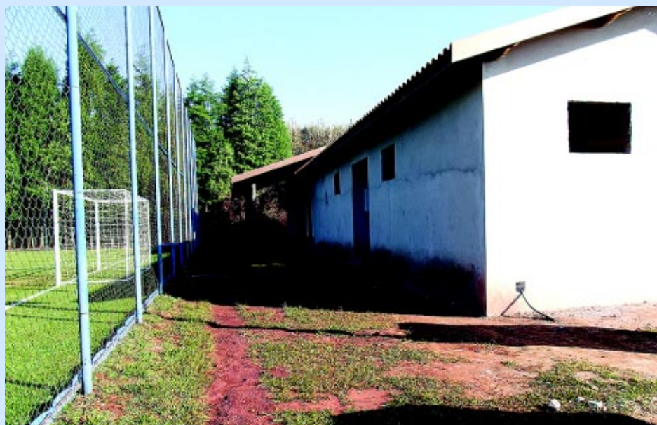
As obras já estão em fase final e são fruto de uma iniciativa da diretoria do Sindicato para melhorar a infraestrutura da nossa Sede Campestre