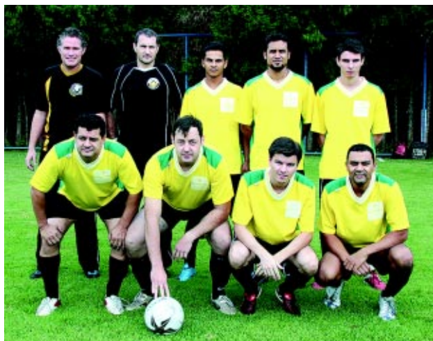
TC Mercenários OJI