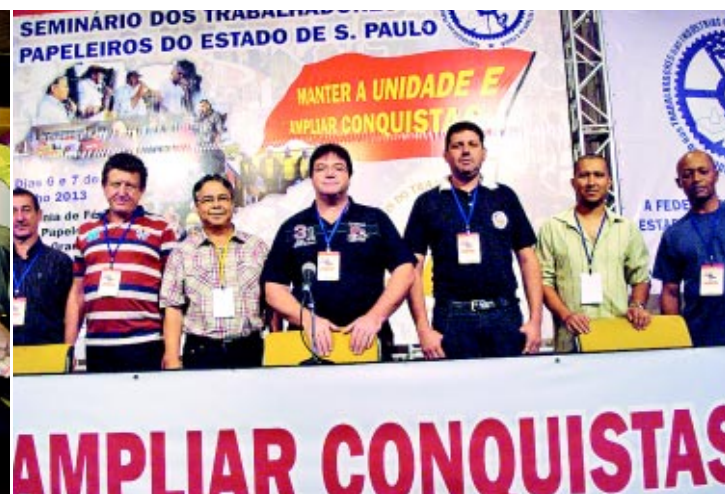
Diretores do nosso Sindicato participaram do Encontro Estadual, promovido pela Federação, e ajudaram a tirar pontos que devem ser incluídos na pauta de reivindicações