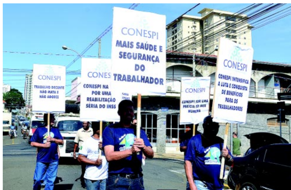
Diretores do nosso Sindicato ajudaram a engrossar a manifestação, que tomou as ruas centrais da cidade

Obs: na Justiça, um documento é a prova necessária para garantir o direito do trabalhador. Por isso, o nosso alerta é para que guarde sempre uma cópia do documento que entregar na empresa.