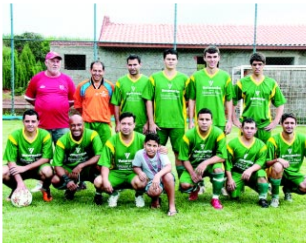
TD Chama na Birra OJI