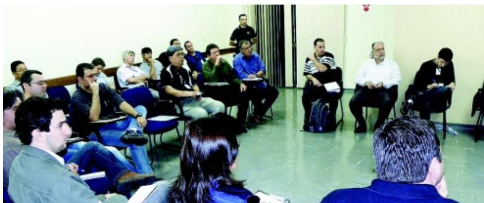
A comissão se reúne mensalmente, para dar continuidade à revisão do Manual de Segurança, que é referência nacional

A Comissão tripartite, que desde o ano passado trabalha na revisão do manual de segurança de máquinas de papel, papelão e celulose, tem continuado o trabalho. A próxima reunião acontecerá no dia 20 de junho, às 9 horas, na Klabin, e todas as empresas ficaram de apresentar vídeo e fotos sobre o funcionamento da mesa plana.